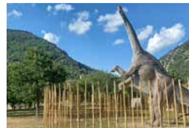
Il sauropode

a suo tempo programmato e finalizzato e che è stato completato al termine del mandato amministrativo. È un ulteriore, fondamentale tassello di una precisa visione culturale, formativa, didattica e turistica che è stata costruita nel tempo, immaginando per questo